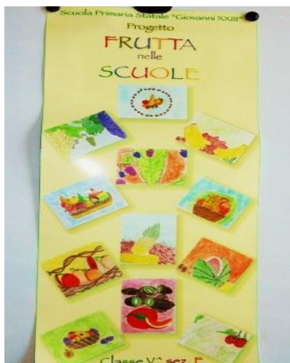
Elegante poster in pellicola lucida